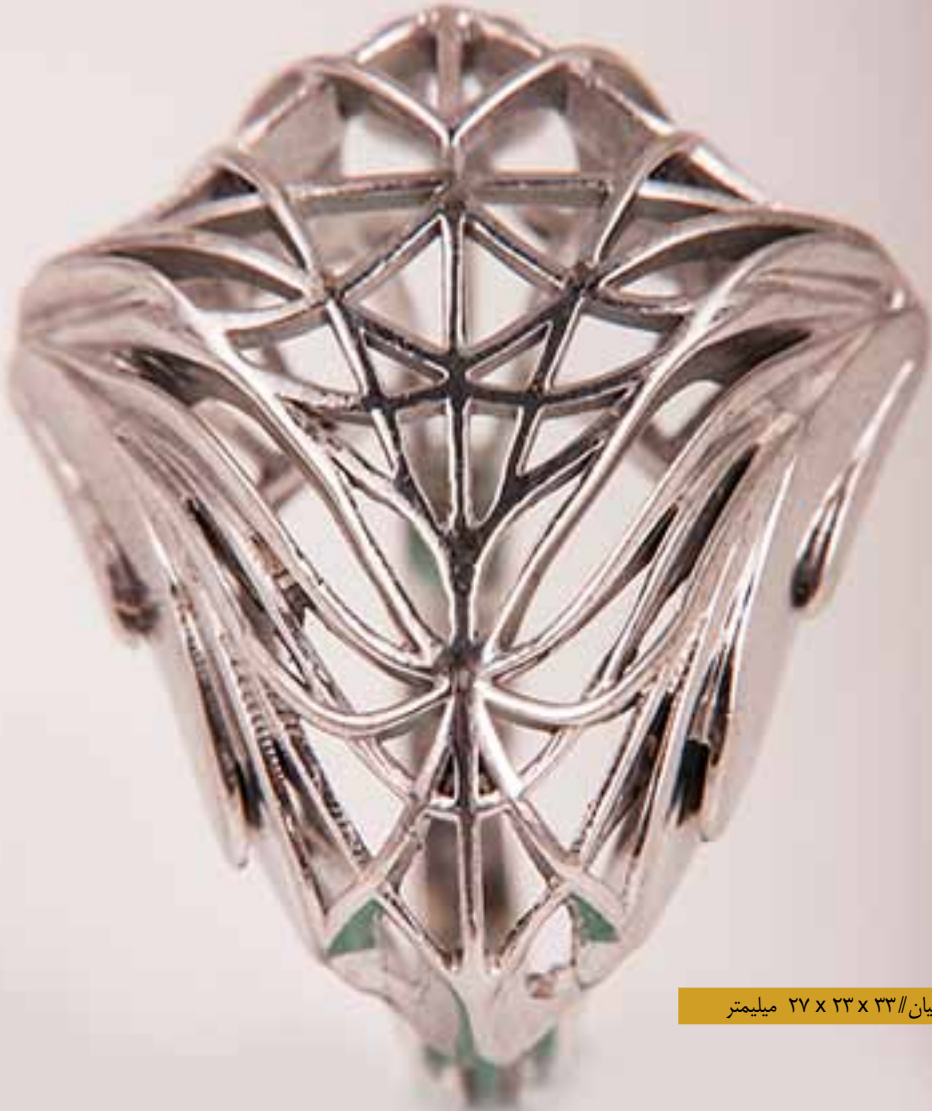
میان // ۳۳ x ۲۳ x ۲۷ میلیمتر